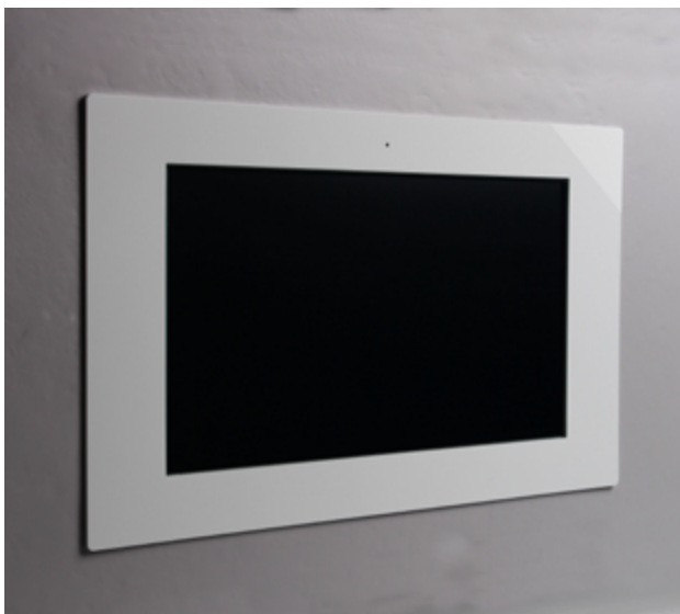
Beispiel: Austauschkit für Gira Client 19 mit Acrylglas-Rahmen